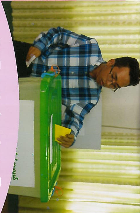
(၂) အပြော/အကြား အာရုံချို့ယွင်းအားနည်းသူ (နားမကြားသူ မဲဆန္ဒရှင်များ) ဆန္ဒမဲပေးရာတွင် လိုအပ်သော အချက်များ