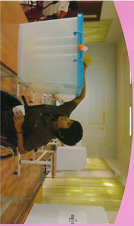
မဲရုံပေး