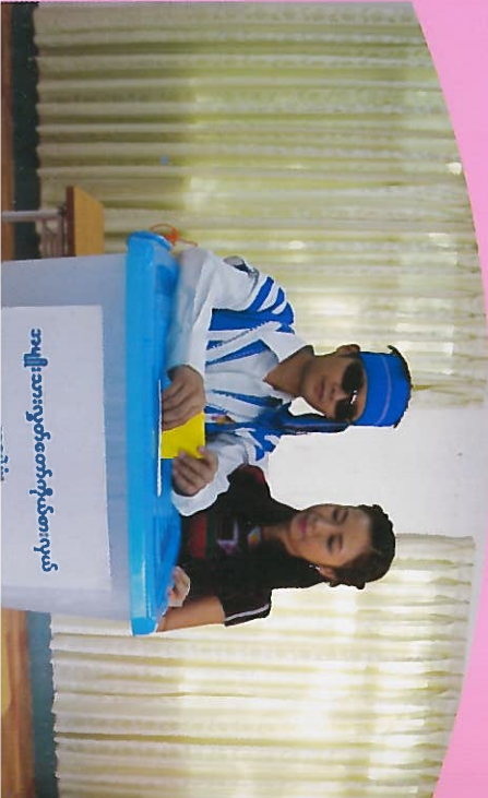
အမျိုးသားလွှတ်တော်ကိုယ်စားလှယ်